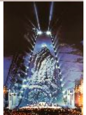
高低落差视觉示意图