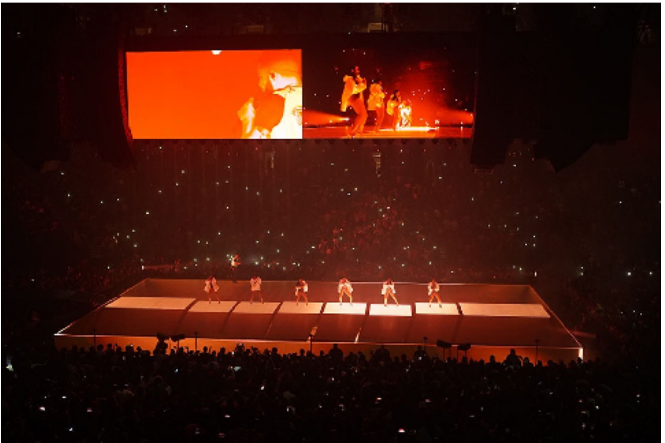
舞台2垫高及地屏示意图